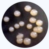
Kolonia Azotobacter na pożywce hodowlanej